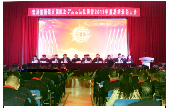
1 a 19日, 宏河集团第五届四次职代会(工代会)暨2019年度总结表彰大会在横河煤矿职工bc召开。

! " # $ % & ' ( ' ) * + , - . - / 0 * 1 2 3 4 5 6 7 8 % 9 :